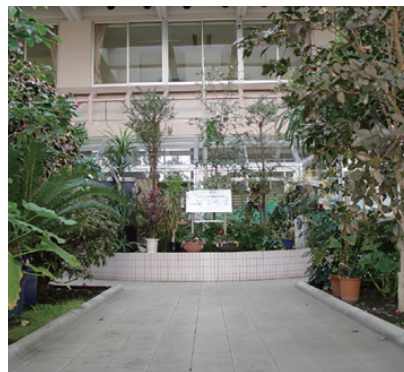
エントラスホール