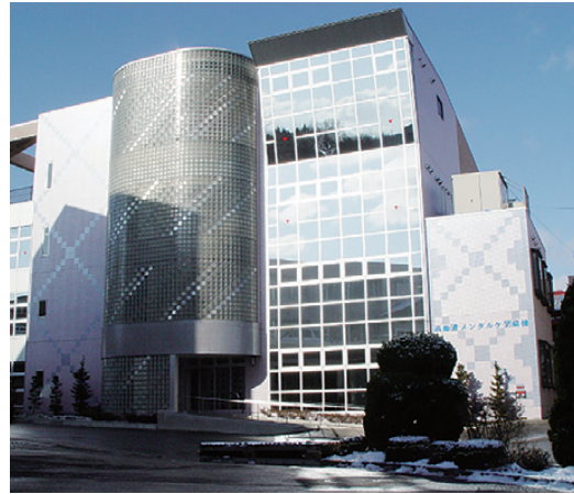
メンタルケア病棟