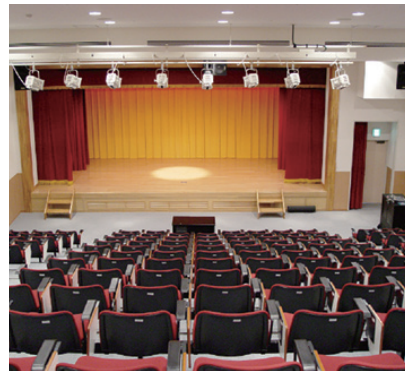
千葉記念講堂・メモリアルホール